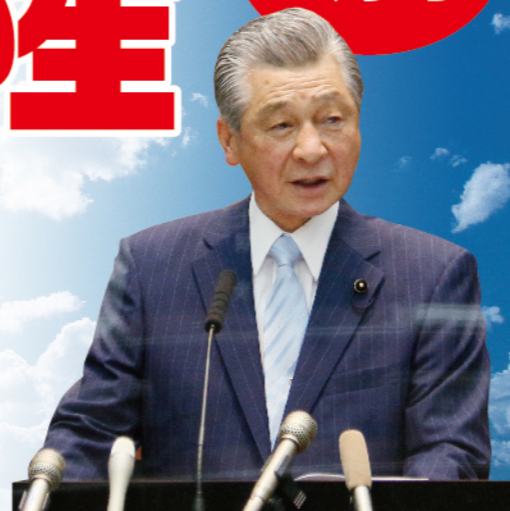
新型コロナウイルス感染症対策のため、演台にアクリル板を設置しております。そのため、一部の写真に反射光が見られますがご了承ください。

〒780-8570 高知市丸ノ内 1-2-20 県議会自由民主党控室 TEL 088-823-9522