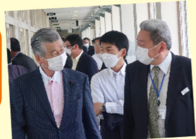
安芸中・高等学校