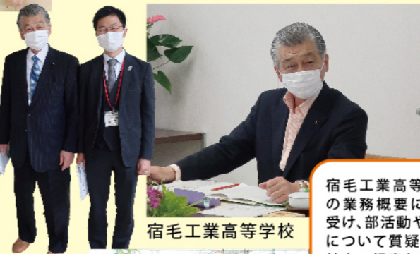
宿毛工業高等学校

宿毛工業高等学校では学校の業務概要について説明を受け、部活動や生徒会活動等について質疑を行い、その後校内の視察を行いました。