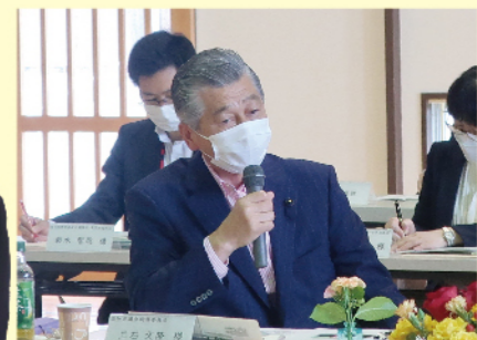
土佐市立蓮池小学校