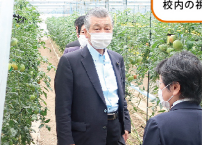
高知農業高等学校