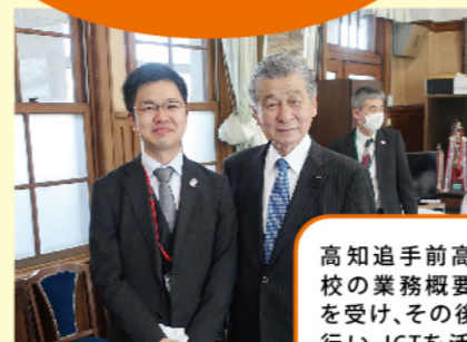
高知追手前高等学校

高知追手前高等学校では学校の業務概要について説明を受け、その後校内の視察を行い、ICTを活用した授業等について質疑を行いました。