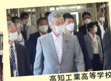
高知工業高等学校

高知追手前高等学校では学校の業務概要について説明を受け、その後校内の視察を行い、ICTを活用した授業等について質疑を行いました。