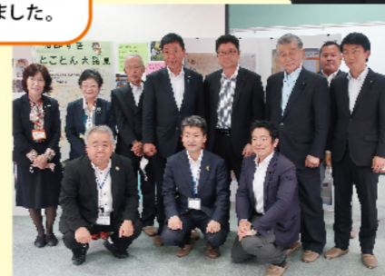
香美市立大橋中学校