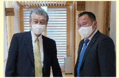
心の教育センター