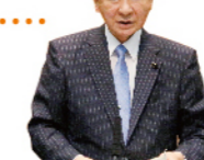
総務委員会で委員を務める。